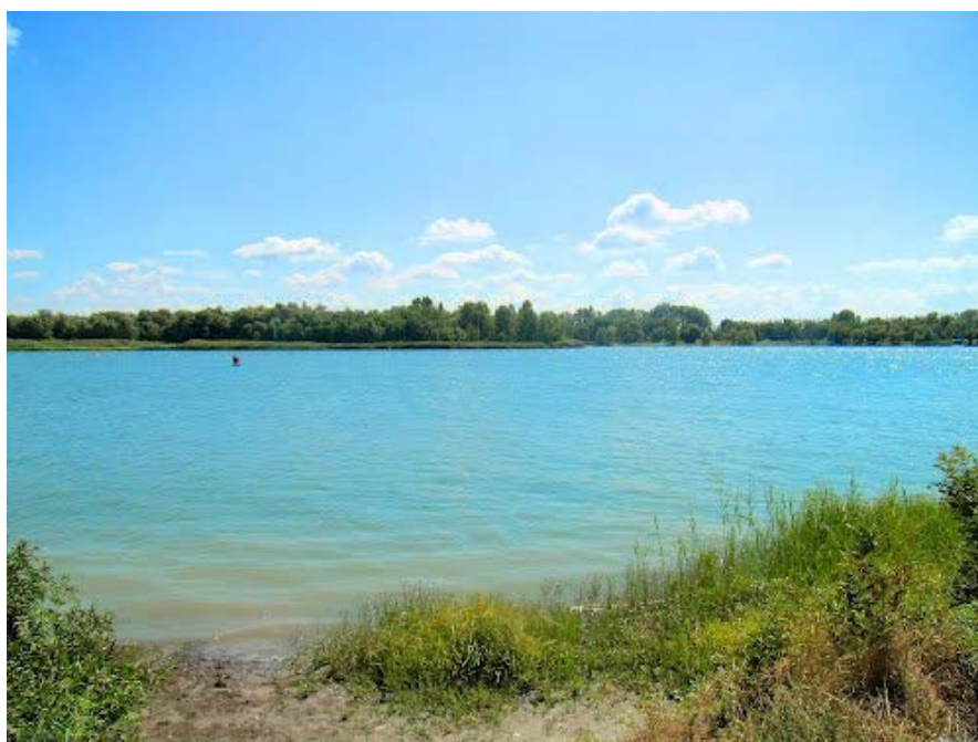
Рисунок 6.2. Река Дон в месте перехода ВСМ Центр-Юг Варианты 1 и 3

Ледовый режим на реках начинается в конце ноября переходом температуры воды через «0» градуса, ледостав устанавливается в декабре-январе. Ледоход на Дону начинается в середине марта и к началу апреля река полностью освобождается ото льда.