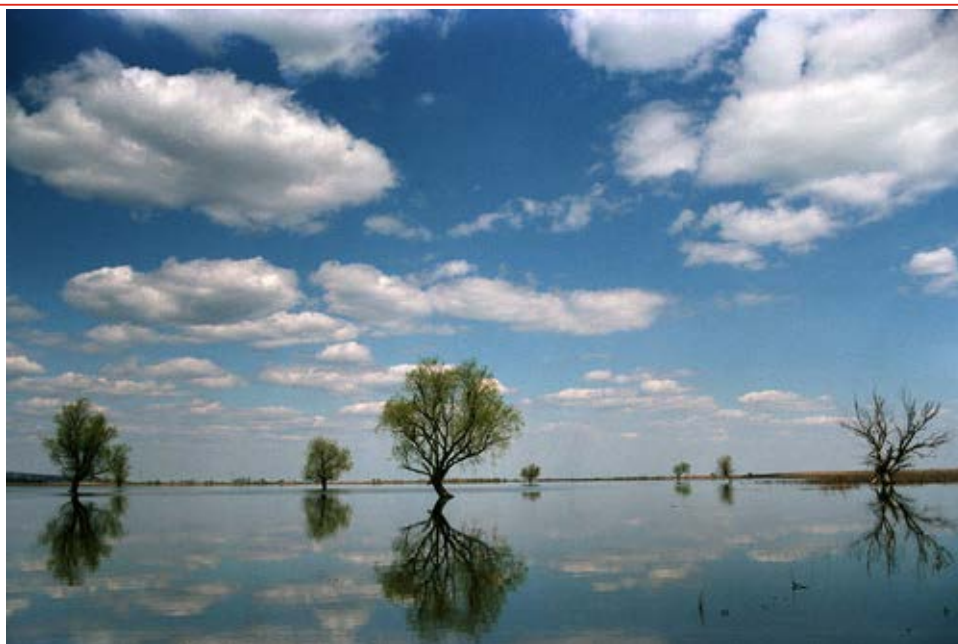
Рисунок 6.1. Река Аксай весной в месте перехода ВСМ Центр-Юг Варианты 1 и 3