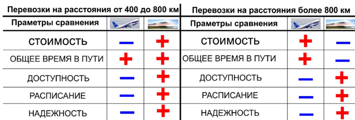
Таблица 2.1. Сравнение привлекательности перевозок для пассажиров авиационным и высокоскоростным железнодорожным транспортом в зависимости от расстояния.

Высокоскоростное железнодорожное сообщение по ВСМ—Центр-Юг должно усилить экономическую конкуренцию, прежде всего с авиатранспортом, особенно в летний период с сезонным максимумом пассажиропотока. Такая конкуренция должна оказать положительное влияние на ценообразование в авиационных и в железнодорожных перевозках.